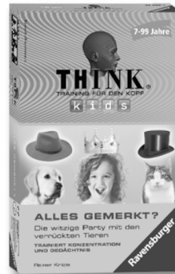
Alles gemerkt? 23 296 3

Warnung! Für Kinder unter 36 Monaten nicht geeignet. Erstickengefahr wegen verschluckbarer Kleinteile.