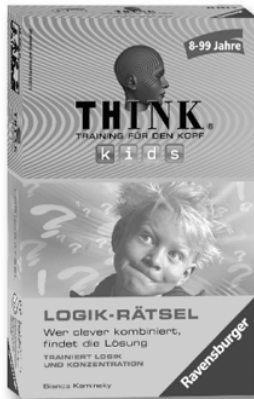
Logik-Rätsel 23 294 9