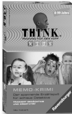
Memo-Krimi 23 295 6