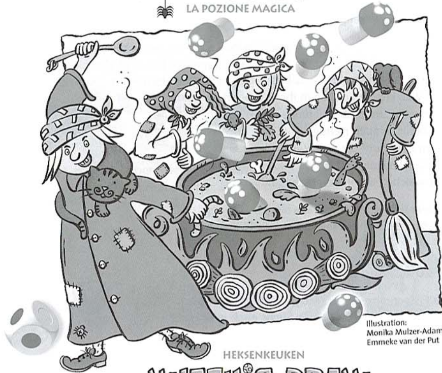
Illustration: Monika Mulzer-Adam, Emmeke van der Put