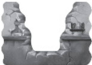
Passaggio libero per qualsiasi animale