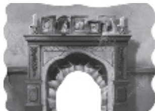
Tana del topino: il leprotto non passa!