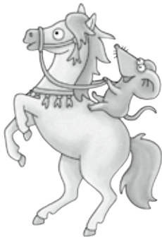
Illustration und Design: Eva Künzel

Redaktion: Cornelia Keller, Nicole Wasel